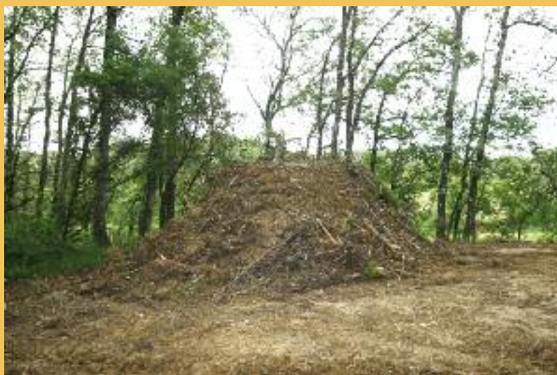
L'une des garennes artificielles