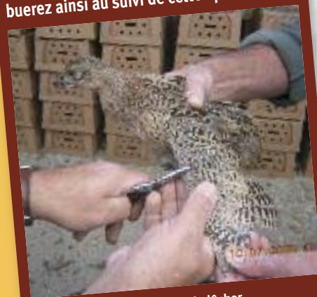
Marquage des faisans avant le lâcher Photo FDC 09 - Pascal Fosty

Vous prélèverez peut être l'un de ces oiseaux à la chasse. Vous le reconnaîtrez à l'identification « FDC 09 » de la bague alaire. N'hésitez pas à informer la Fédération du lieu et de la date de la capture. Vous contribuerez ainsi au suivi de cette opération.