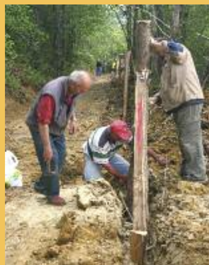
Implantation de la clôture