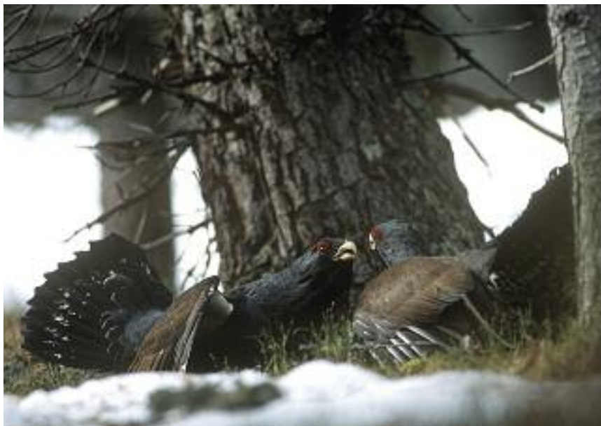
Combat de coqs