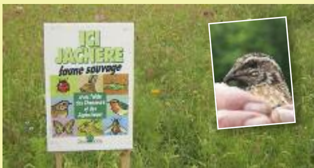
Jachère faune sauvage à Mazères le 28/08/09

Parmi les espèces qui profitent largement de ces aménagements, la caille des blés figure en bonne place. Une étude est engagée sur cette espèce et fera l'objet d'un article dans une prochaine gazette.