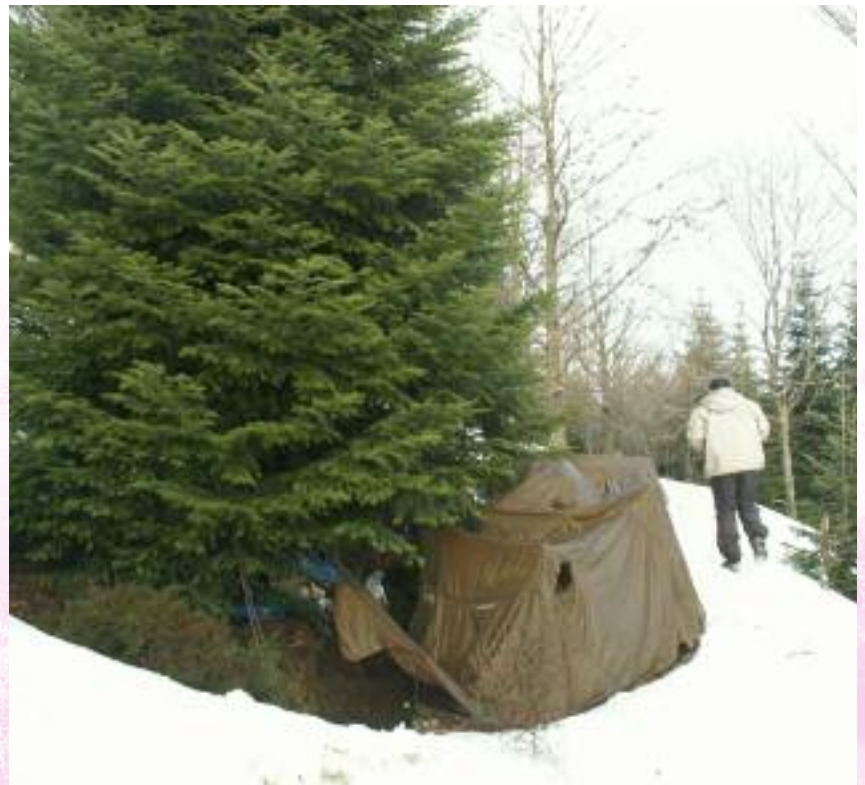
Affût sur place de chant

La principale limite de cette méthode est qu'il est impossible de dénombrer toutes les poules présentes sur le secteur concerné par la place de chant.