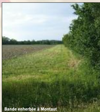
Bande enherbée à Montaut

Nous reviendrons dans une prochaine Gazette sur les actions mises en œuvre dans le département.