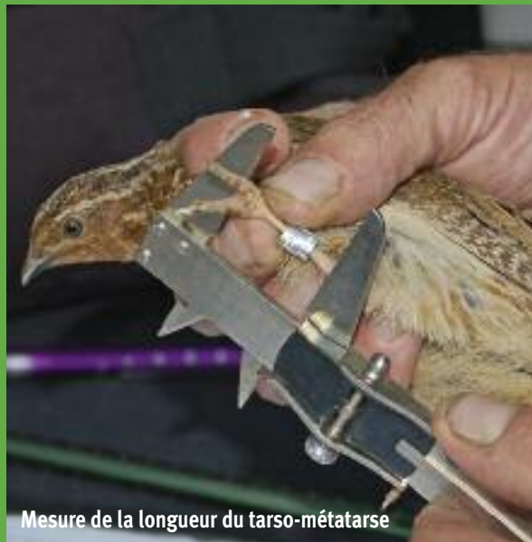
Mesure de la longueur du tarso-métatarse