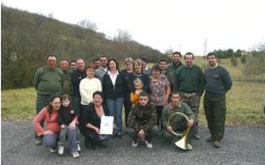
L'équipe du GIC de l'Arize

L'édition 2003 de la Coupe de France organisée par le GIC a drainé un millier de personnes venues de nombreux départements