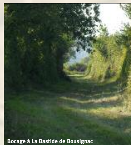
Bocage à La Bastide de Bousignac