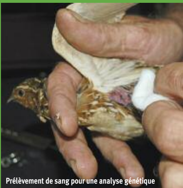
Prélèvement de sang pour une analyse génétique