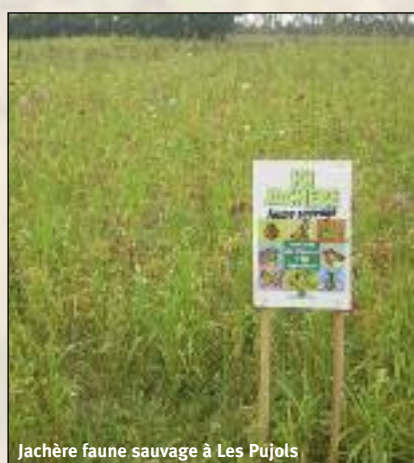
Jachère faune sauvage à Les Pujols