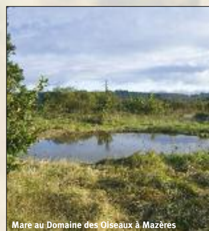
Mare au Domaine des Oiseaux à Mazères