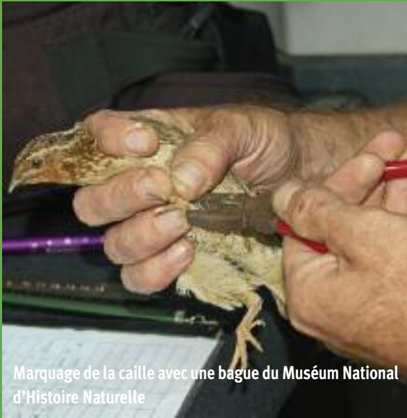
Marquage de la caille avec une bague du Muséum National d'Histoire Naturelle