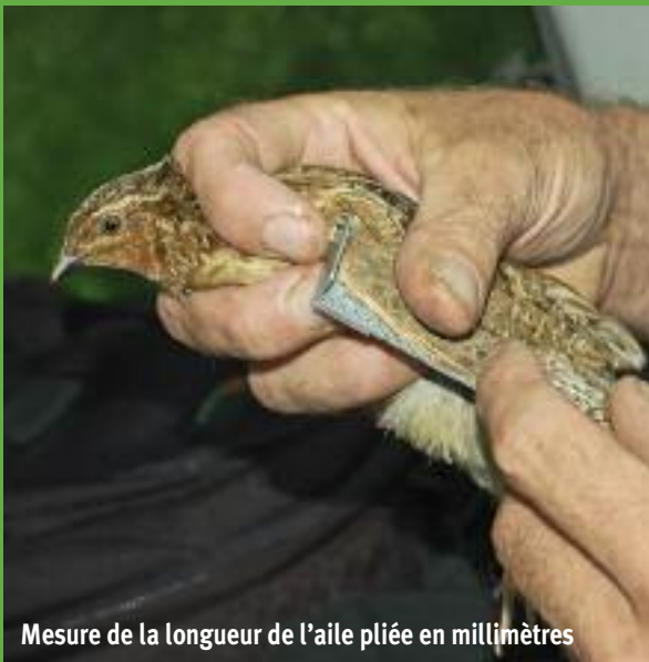
Mesure de la longueur de l'aile pliée en millimètres