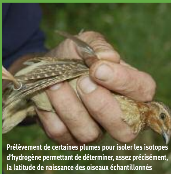
Prélèvement de certaines plumes pour isoler les isotopes d'hydrogène permettant de déterminer, assez précisément, la latitude de naissance des oiseaux échantillonnés