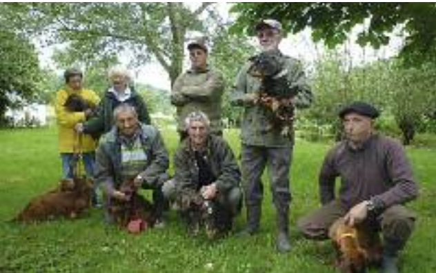
Epreuve de recherche de sang à Alzen (édition 2009)

délégué départemental de l'Union Nationale pour l'Utilisation des Chiens de Rouge