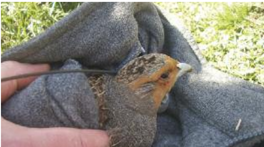
Perdrix équipée d'un collier émetteur