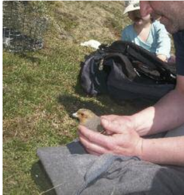
La durée de la manipulation n'excède pas quelques minutes