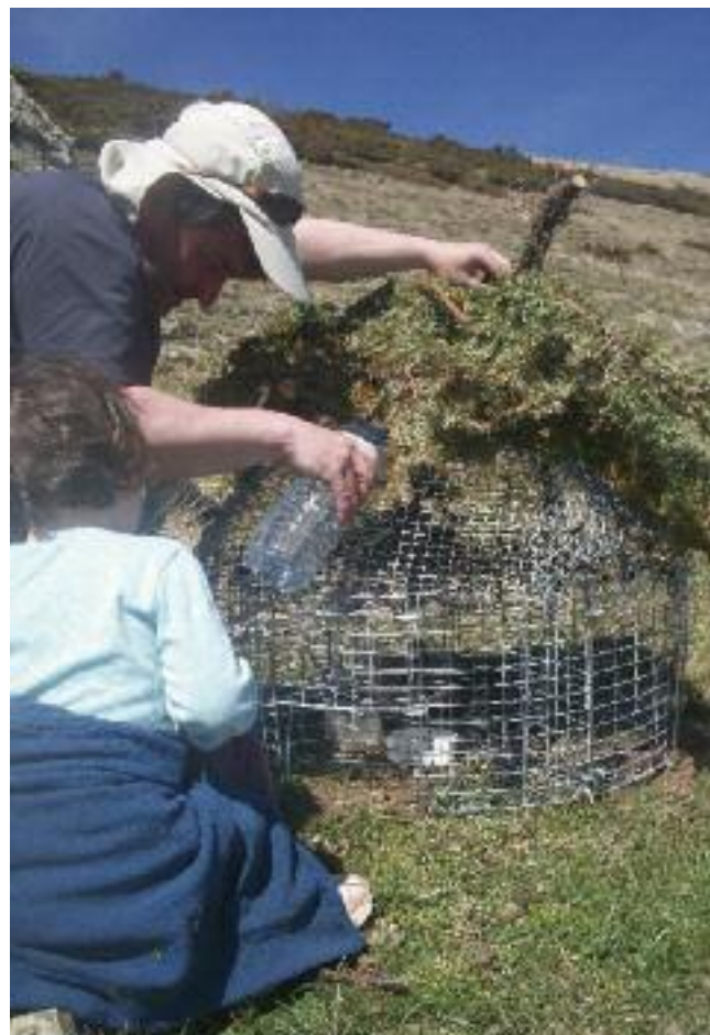
Nourrissage des appelants