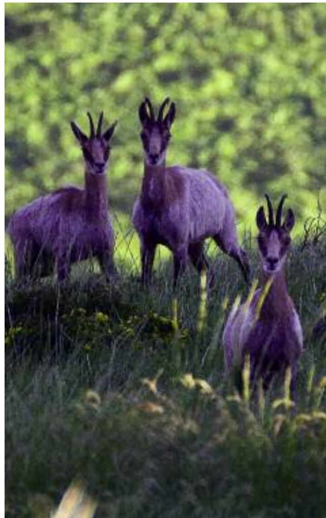
Groupe de males à Saurat

Depuis deux ans nous effectuons un suivi plus précis à l'aide de lunettes terrestres à très fort grossissement sur certaines chevrées afin de déterminer le nombre de chevreaux présent. Ce suivi fin de chevrées ne se pratique que sur certains territoires. En 2015, sur 27 chevrées 29% des animaux observés étaient des chevreaux. En 2016 sur 26 chevrées 41% des animaux observés sont des chevreaux. Nous avons apparemment une très bonne reproduction avec une très nette différence par rapport à l'année précédente. Dans un contexte sanitaire toujours difficile avec la présence de foyers de pestivirus, cette observation est plutôt en-