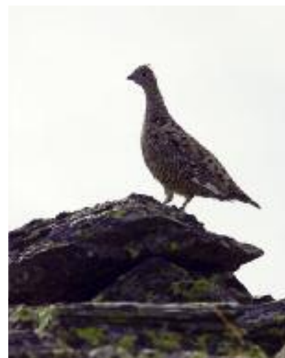
Lagopède alpin femelle