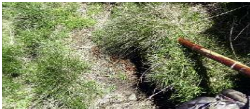
Crottier concentré de lagopède