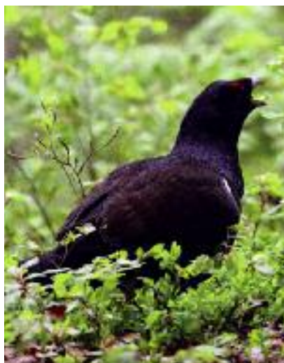
Grand tétras mâle