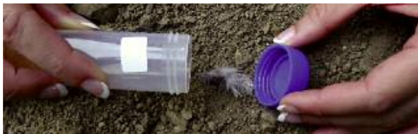
Récolte d'un échantillon

Enfin, cette étude permettra l'obtention d'estimations robustes et éprouvées sur les effectifs de lagopède alpin et de grand tétras sur des zones de références.