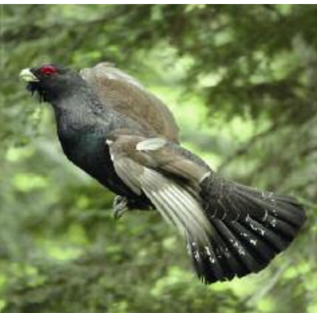
Grand Tétrás en vol

Pour ces trois espèces, les conditions atmosphériques défavorables ont souvent impacté la pratique de cette chasse.