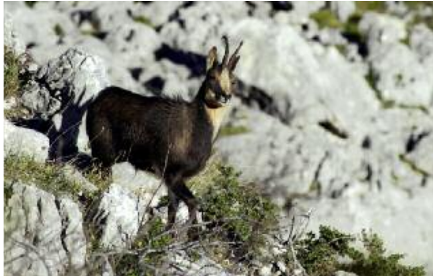
Isard mâle

De faibles densités subsistent localement et l'espèce a encore de vastes espaces à recoloniser suite aux épisodes de pestivirose mais, de manière générale, les plus belles densités ne sont plus en haute montagne mais plutôt dans les zones boisées ou sur le piémont pyrénéen.