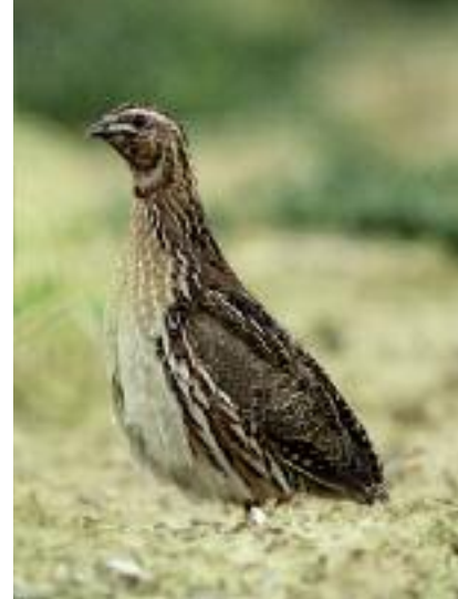
Caille des blés à Gaudiès

répartition européenne. On connaît la suite de l'histoire, plusieurs dépressions s'installent sur la chaîne pyrénéenne et entravent la migration pré-nuptiale des cailles mais aussi d'un bon nombre d'autres espèces. Dans le même temps, les conditions en Espagne sont excellentes, avec de fortes pluies en fin d'hiver, les céréales sont magnifiques et offrent aux cailles de vastes espaces pour se reproduire. Fin juin et début juillet, la météo s'améliore et nous observons une nouvelle vague très importante avec une proportion très élevée de jeunes nés 6 à 12 semaines plus tôt en Espagne ou en Afrique du Nord et prêts à accomplir, à leur tour une reproduction chez nous. Une partie de ces reproducteurs potentiels y parviendront car, en France, les moissons ont débuté et les chances de trouver un site pour installer un nid, en toute quiétude s'amenuisent de jours en jours. C'est bien la deuxième vague de migration, celle qui nous garantit des nichées matures à l'ouverture de fin août, habituellement calée sur le mois