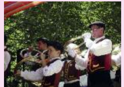
Les échos de Combelongue Photo Laurent CHAYRON FDC 09